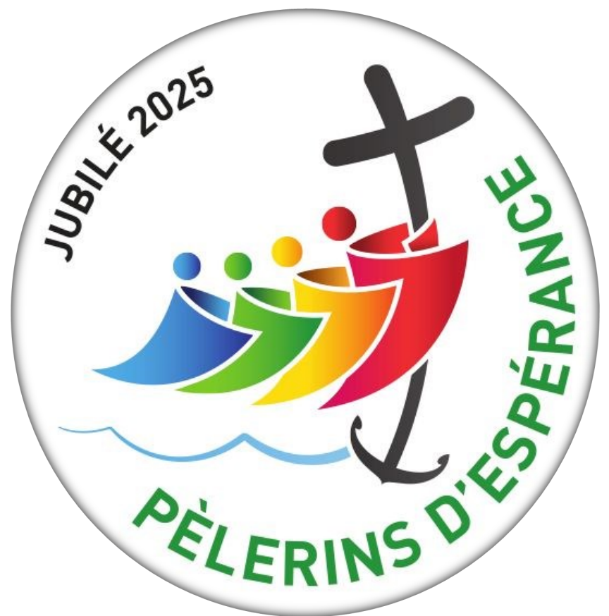
Logo officiel du Jubilé 2025